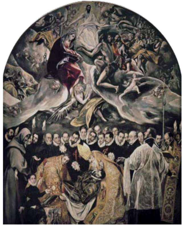
El entierro del conde de Orgaz