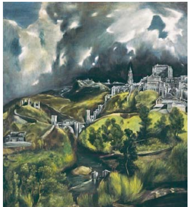
Vista de Toledo